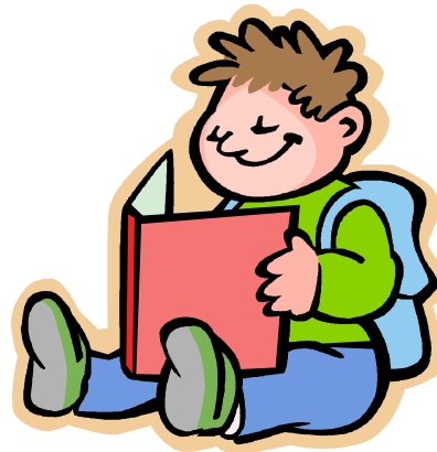
Slika 1. Primer slike iz eksperimenta